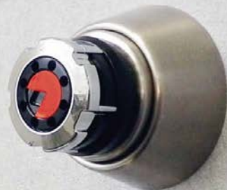
※U9シリンダーへの使用例